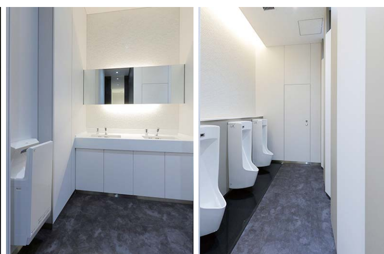
基準階 男性用トイレ

スクエア型の洗面器がスタイリッシュな印象の洗面カウンター。手をかざすだけで吐水・止水できる自動水栓を採用。小便器は壁掛け式で清掃性に優れている。