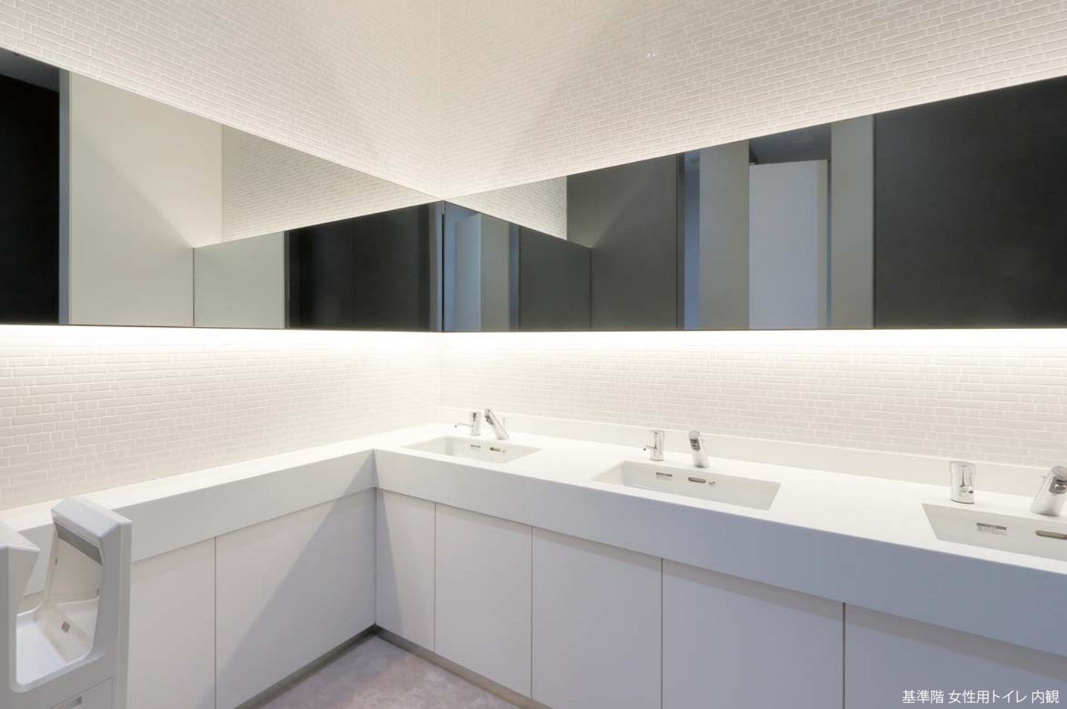
基準階 女性用トイレ 内観