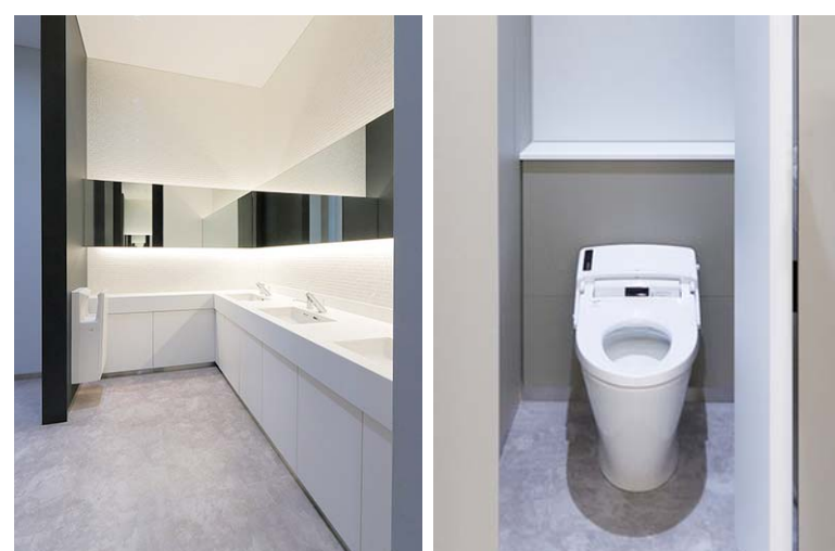
基準階 女性用トイレ

手洗いコーナーとは別にパウダーコーナーが設けられ、落ち着いて化粧直しをしたり、簡易的な荷物置き場として使うことができる。ブース扉は意匠性の高いセミオープンタイプを採用。ブース内部は見えにくくしながら、使用・未使用が一目でわかる。