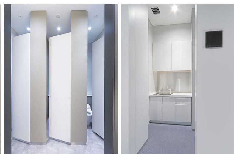
基準階 パントリー

手洗いコーナーとは別にパウダーコーナーが設けられ、落ち着いて化粧直しをしたり、簡易的な荷物置き場として使うことができる。ブース扉は意匠性の高いセミオープンタイプを採用。ブース内部は見えにくくしながら、使用・未使用が一目でわかる。