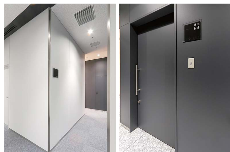
トイレ入り口まわり

左・基準階 一般トイレ(男性用)アプローチ、右・1F 多機能トイレアプローチ。多機能トイレは通路に面しているため、車椅子でもスムーズなアクセスが可能。