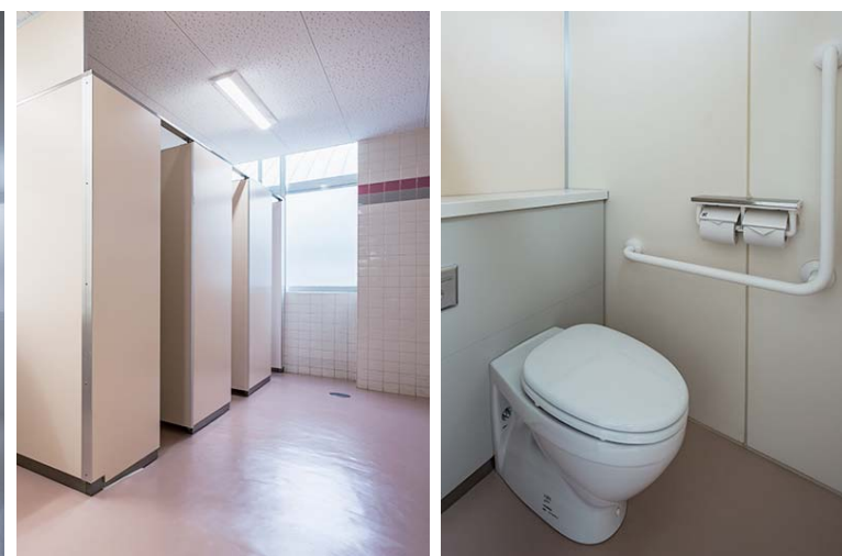
職員用 女性用トイレ

洋式化にともない床はビニル床シートへ変更。乾式清掃のため、清潔感を保ちやすくなっている。