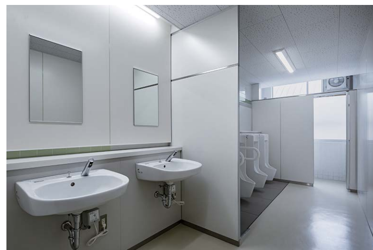
職員用 男性用トイレ

職員用のトイレも同様に改修。洗面エリアには壁付け洗面器を採用することで、スペース効率を高めている。