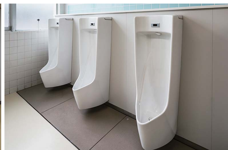
児童用 男性用トイレ

洗浄水量1Lのセンサー一体型ストール小便器を採用し、環境に配慮。壁掛式のため床清掃もしやすくなっている。さらに尿だれを考慮し、汚垂石を設置した。