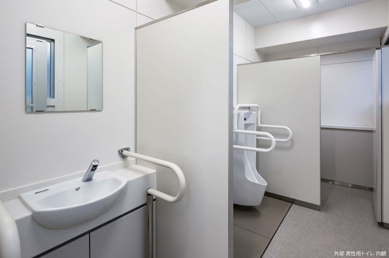
外部 男性用トイレ 内観