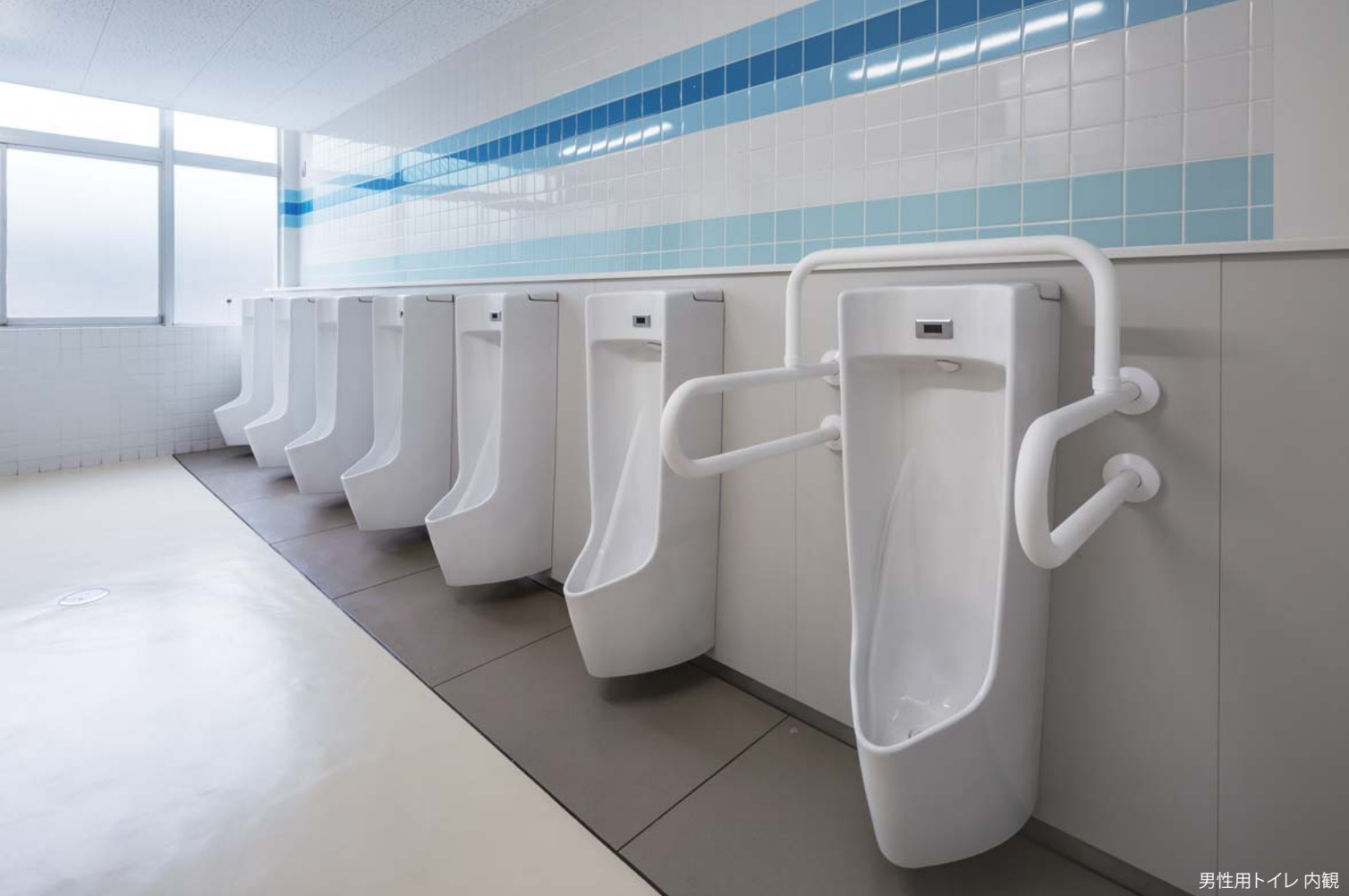
男性用トイレ 内観