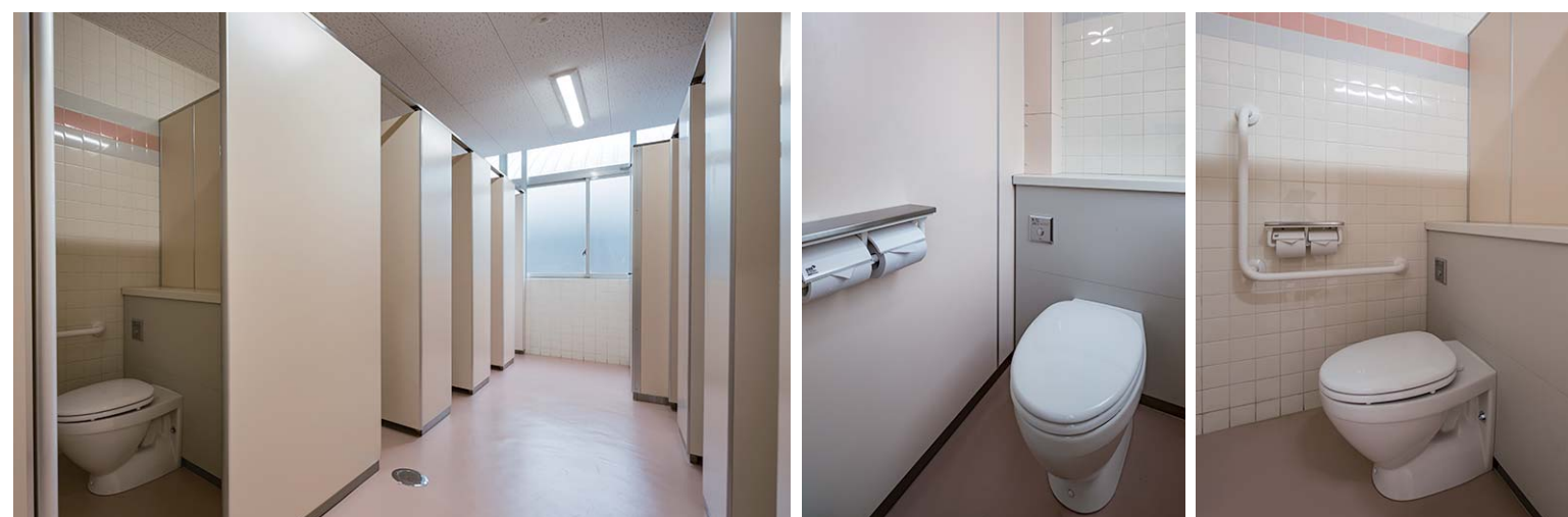
児童用 女性用トイレ

窓からの光を取り込んだ明るい室内。今回の改修で大便器は全て洋式に変更。入り口にあった段差はスロープになりバリアフリー化されている。また、手すりを設けたブースや広めのブースを設置し、様々な利用場面に配慮している。