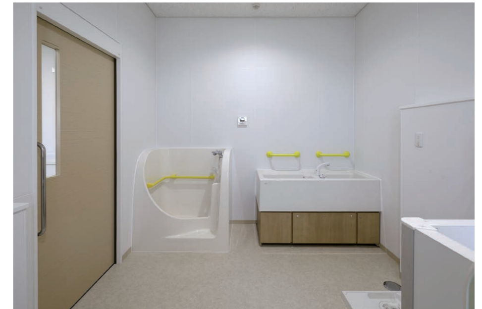
子育て支援センター 保育室トイレ