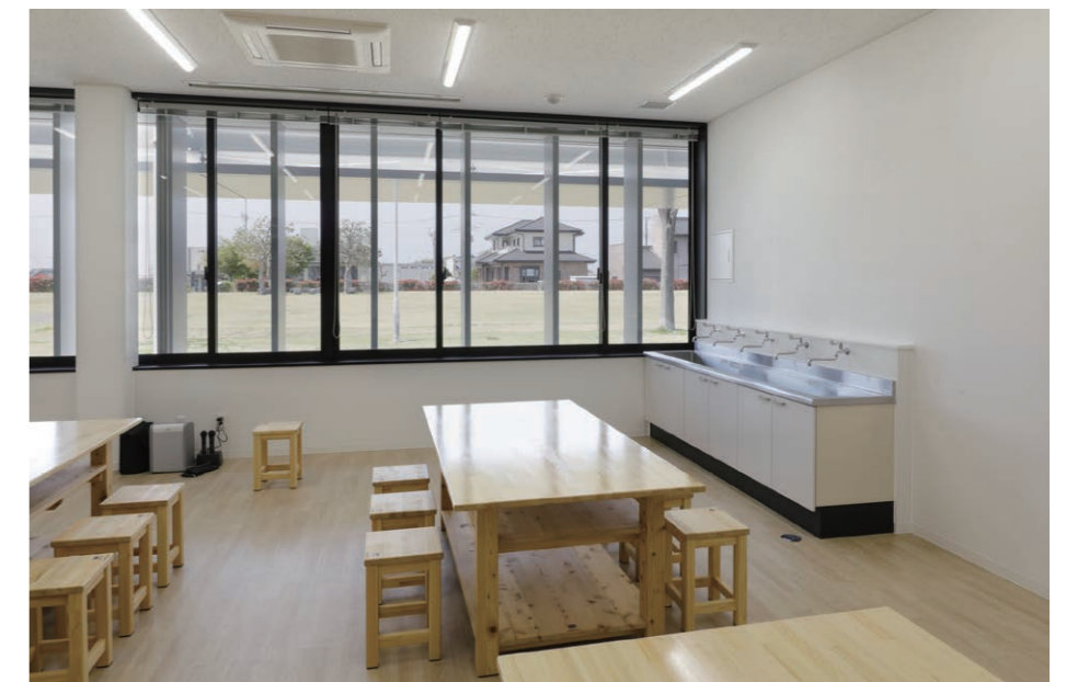
生涯学習センター 工作室 流し台