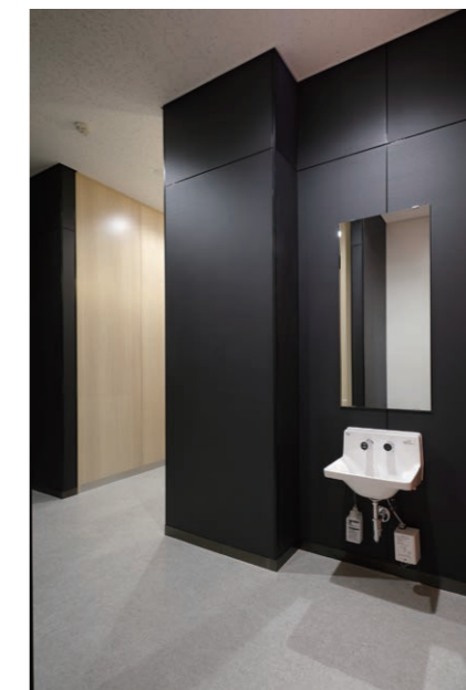
女性用トイレ 子ども用高さの洗面