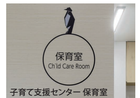
トイレサインと折り紙モチーフのルームサイン