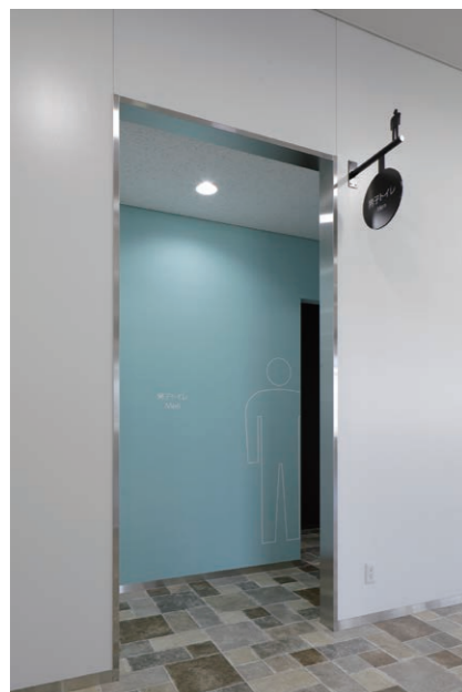
男性用トイレ 入り口