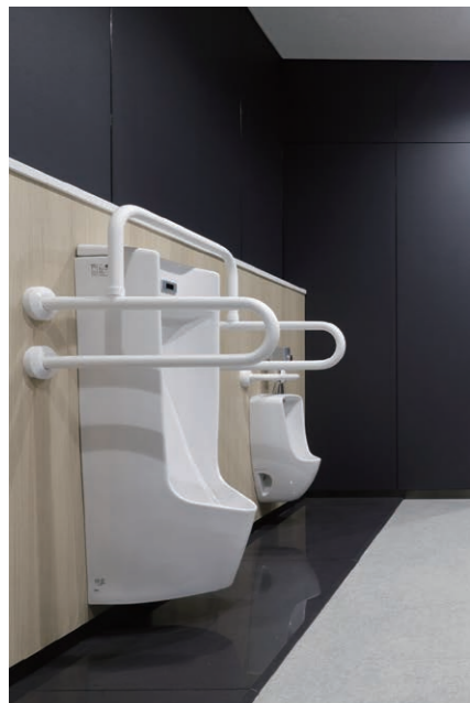
男性用トイレ 小便器

生涯学習・子育て支援の中心拠点施設、及び庁舎の一部機能を統合・最適化した複合施設。