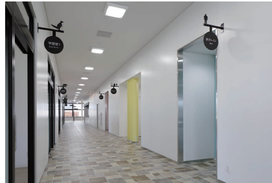
トイレ入り口まわり