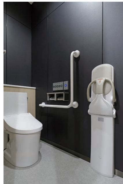
男性用トイレ 大便器