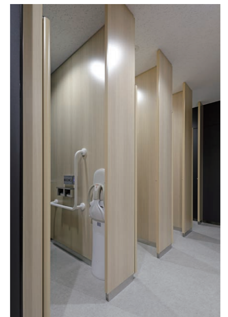
女性用トイレ 天井まであるブース壁