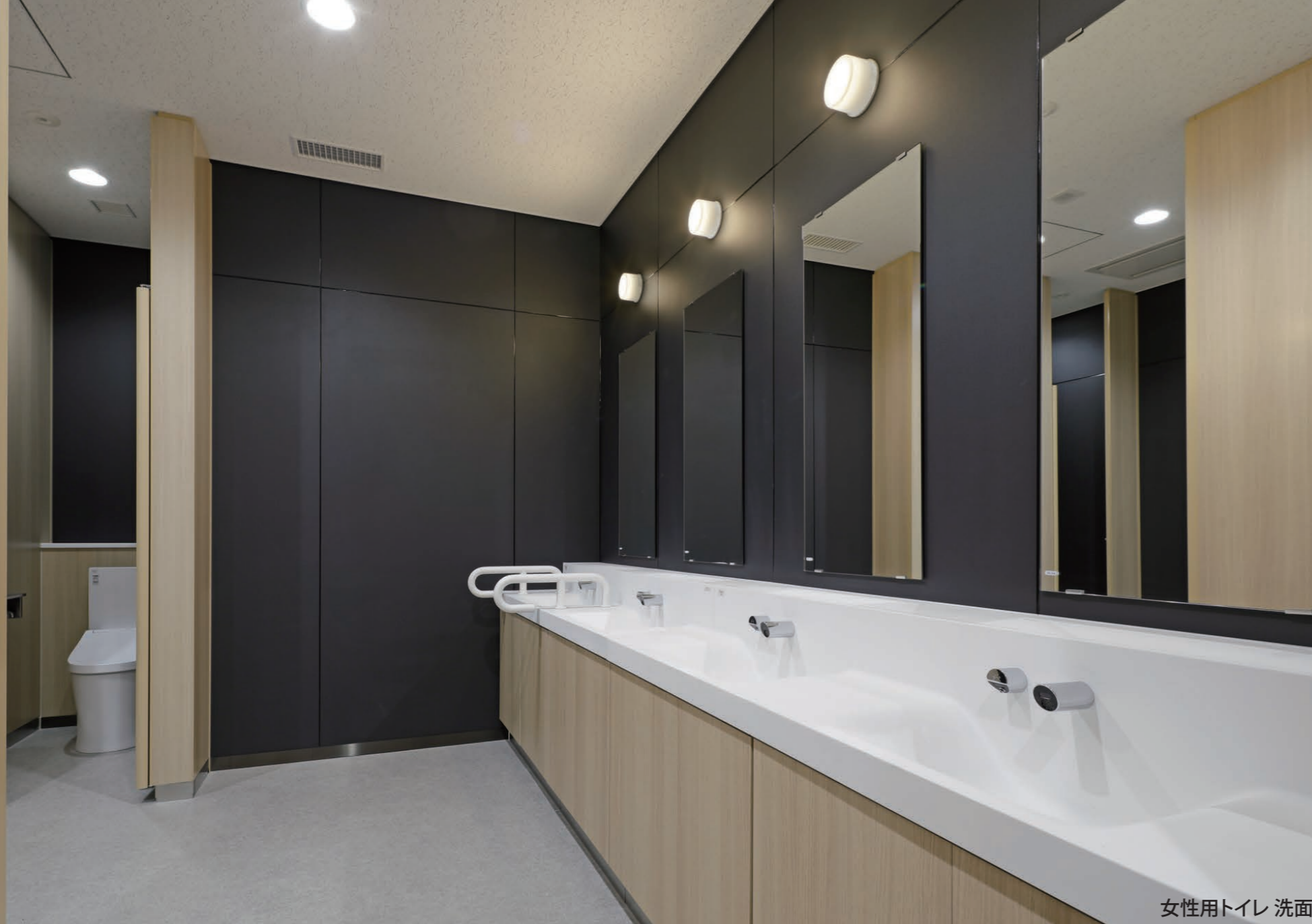
女性用トイレ 洗面

<一般トイレ、子育て支援センター 広めトイレ> 大便器、シャワートイレ : BC-P110S・DQ-PA150CH, CW-PA11M(F)LQE-NE 小便器 : U-A51ML マーベリイナカウンター/シェルフ一体タイプ : MB-550HD7W 洗面器 : L-A951M2E 洗面器、自動水栓、水石けん入れ : L-275N, AM-300C, KF-24F 幼児用便器・暖房便座(3-5歳児用) : C-P143S・DT-520XECH38, CF-43DCK ベビーキープ : AC-BK-F62 <バリアフリートイレ> 大便器 : BC-K21S・DV-K213FL-CK 背もたれ、はね上げ式手すり : KFC-275T1U, KF-471EH70J オストメイトパック : PTOM-B210W 洗面器、自動水栓、水石けん入れ : L-275N, AM-300C, KF-24F おむつ交換台、ベビーキープ、チェンジングボード : AC-OK-F11, AC-BK-F62, AC-CB-01 <授乳室> コンパクトキッチン ティオ <内部通路> マーベリイナカウンター/シェルフ一体タイプ : MB-450HAW <子育て支援センター 保育室> 幼児用便器・暖房便座(3-5歳児用) : C-P143S・DT-520XECH38, CF-43DCK 幼児用便器・暖房便座(1-2歳児用) : C-P141S・DT-520XECH32, CF-7DCK 洗面器 : L-A951M2E 幼児用バス、幼児用シャワーパン : KB-1412D-K1・CB-1412A, PF-1175Y(3)-K2 掃除口付汚物流しセット : S-207NT1NNRP 幼児用マルチシンク : PS-A30C6A2A <生涯学習センター 工作室> 手洗いシンク、水栓金具 : S-1TM270E0BNW, LF-12ZF-13