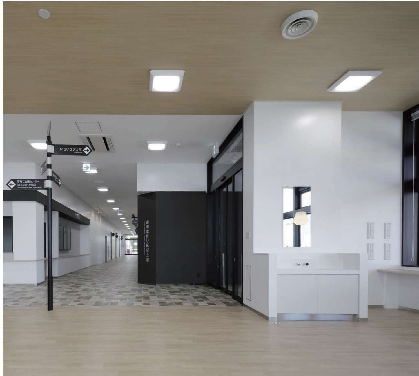
内部通路 建物の出入りの際や飲食可能な「ふれあいラウンジ」の利用時に手洗いができる洗面カウンター