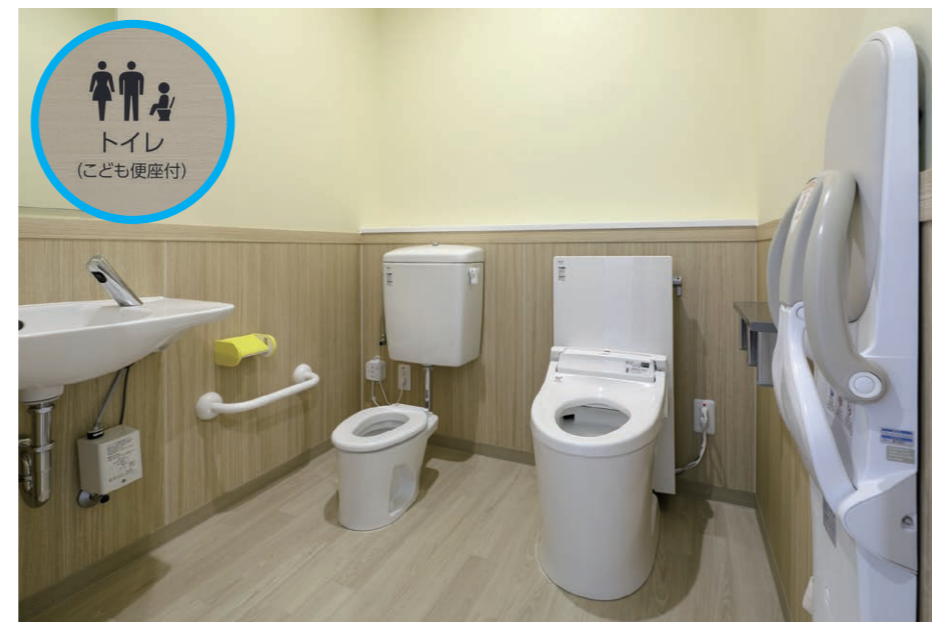
子育て支援センター 広めトイレ(ファミリートイレ)