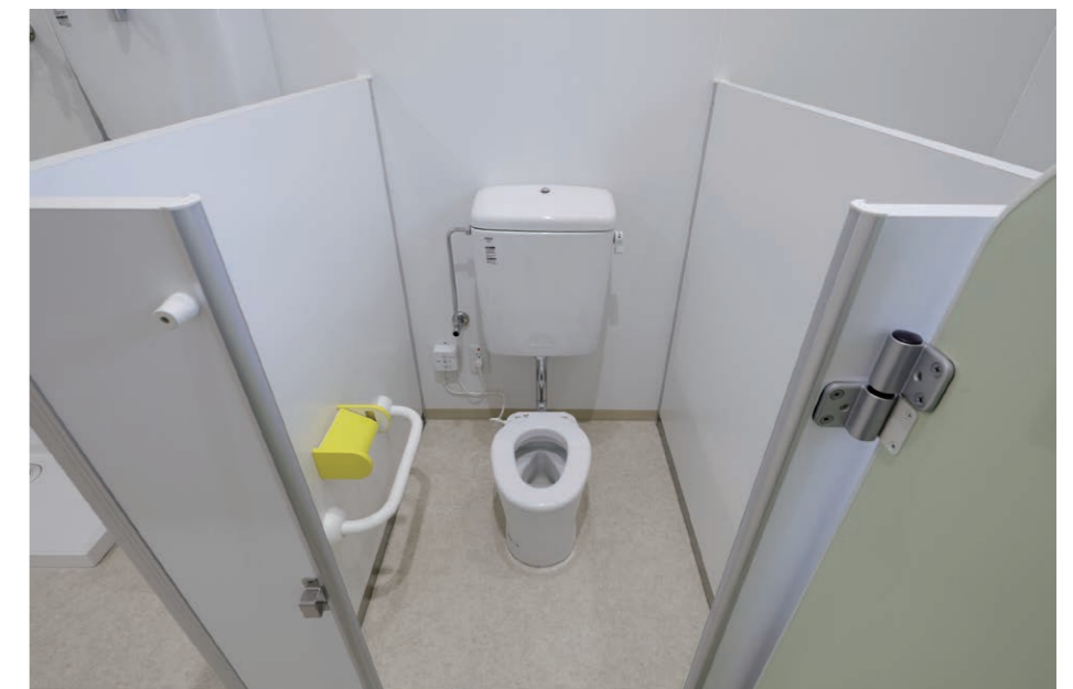
子育て支援センター 保育室トイレ