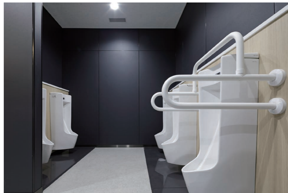
男性用トイレ 小便器