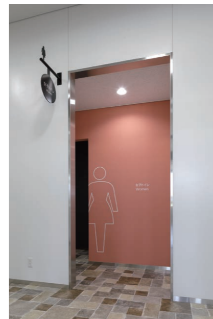
女性用トイレ 入り口