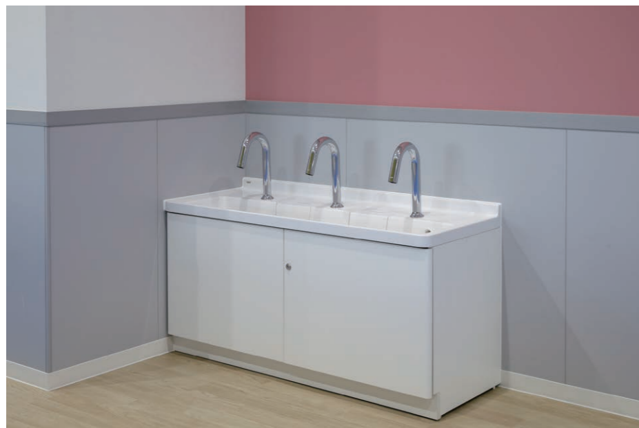
子育て支援センター 玄関前 手洗い