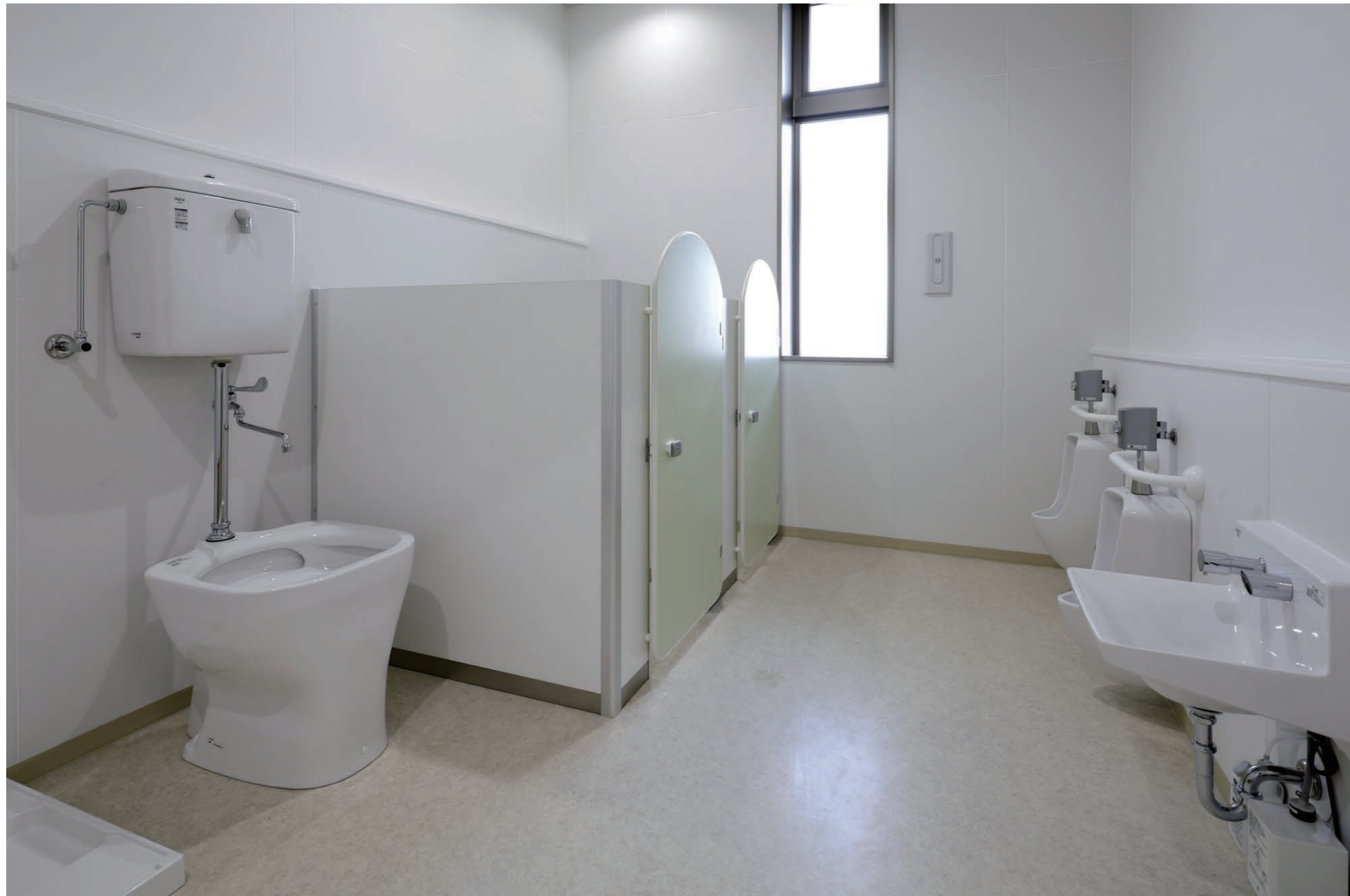
子育て支援センター 保育室トイレ