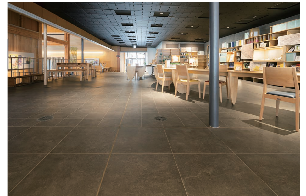
ライブラリ 内装床面