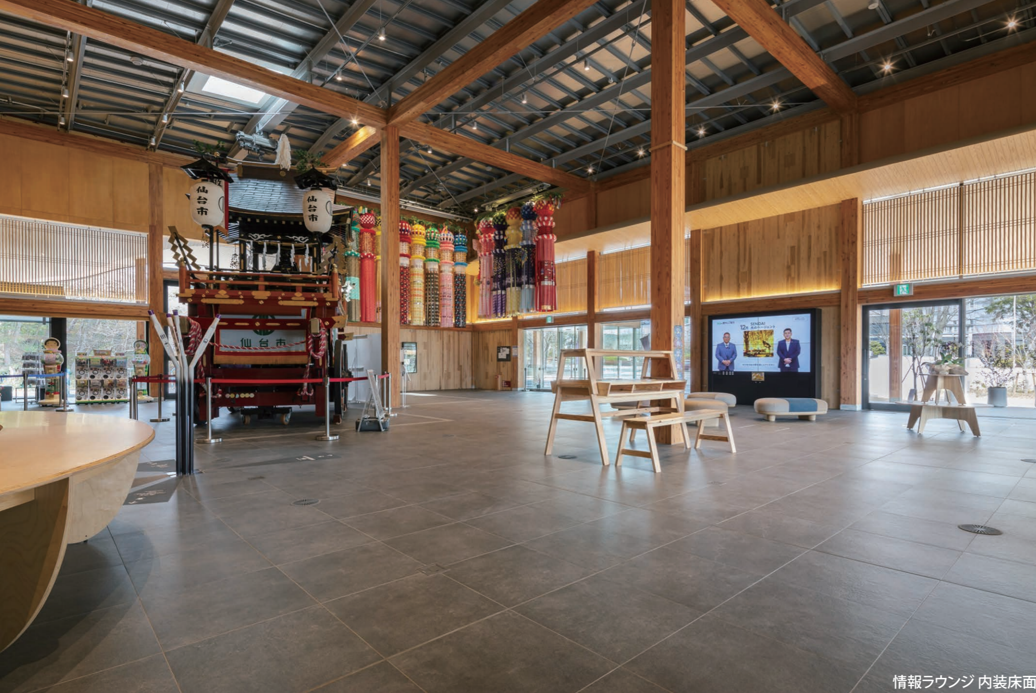
情報ラウンジ 内装床面