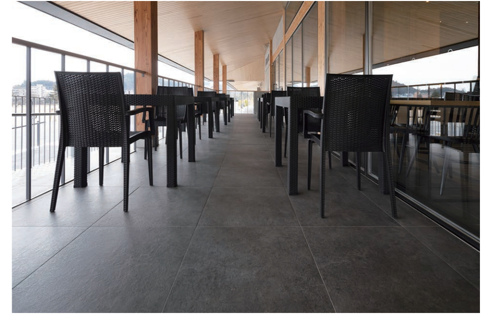
カフェ 外部 外装床面