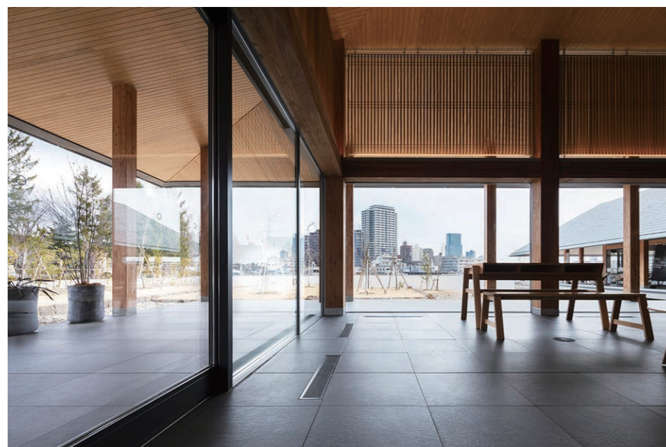
情報ラウンジ・回廊 内装・外装床面

豊かな青葉山の自然、清らかな広瀬川の流れ、仙台の歴史と文化を杜の都の誇りとして後世に伝える公園施設。