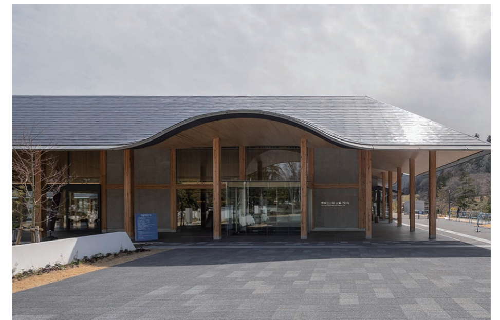
メインエントランス 外観