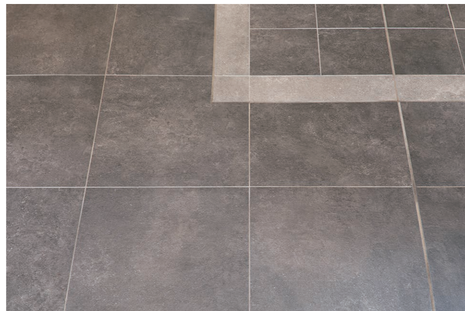
内装床タイル デイテール