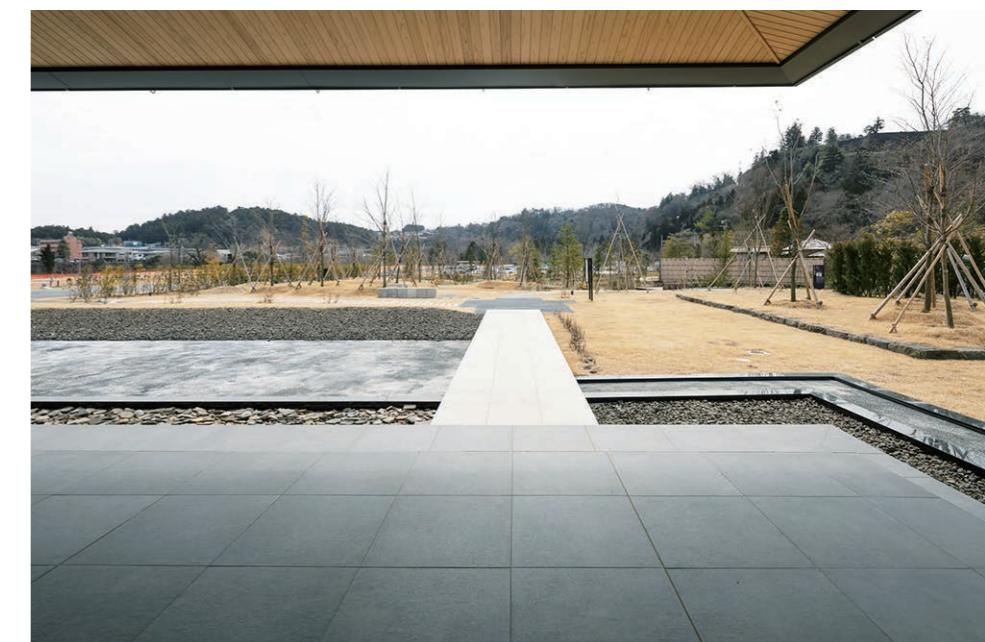
庭園へのアプローチ 外装床面