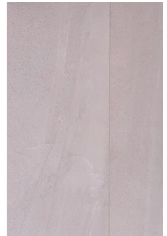
内装壁タイル デティール