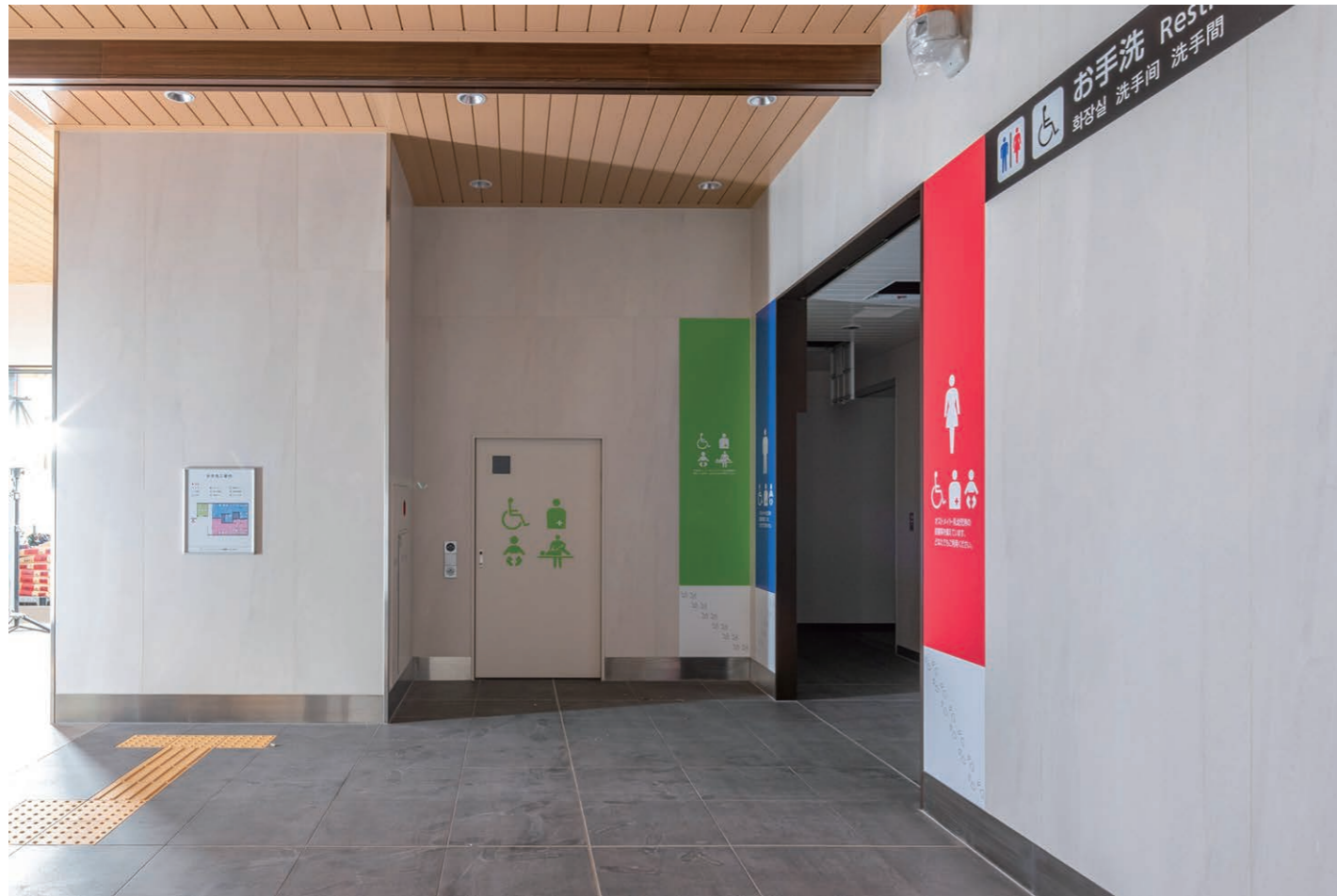
トイレ入り口まわり