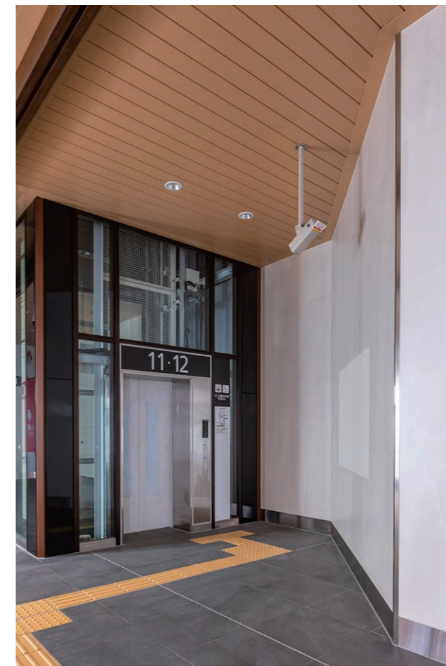
エレベーターまわり 壁面