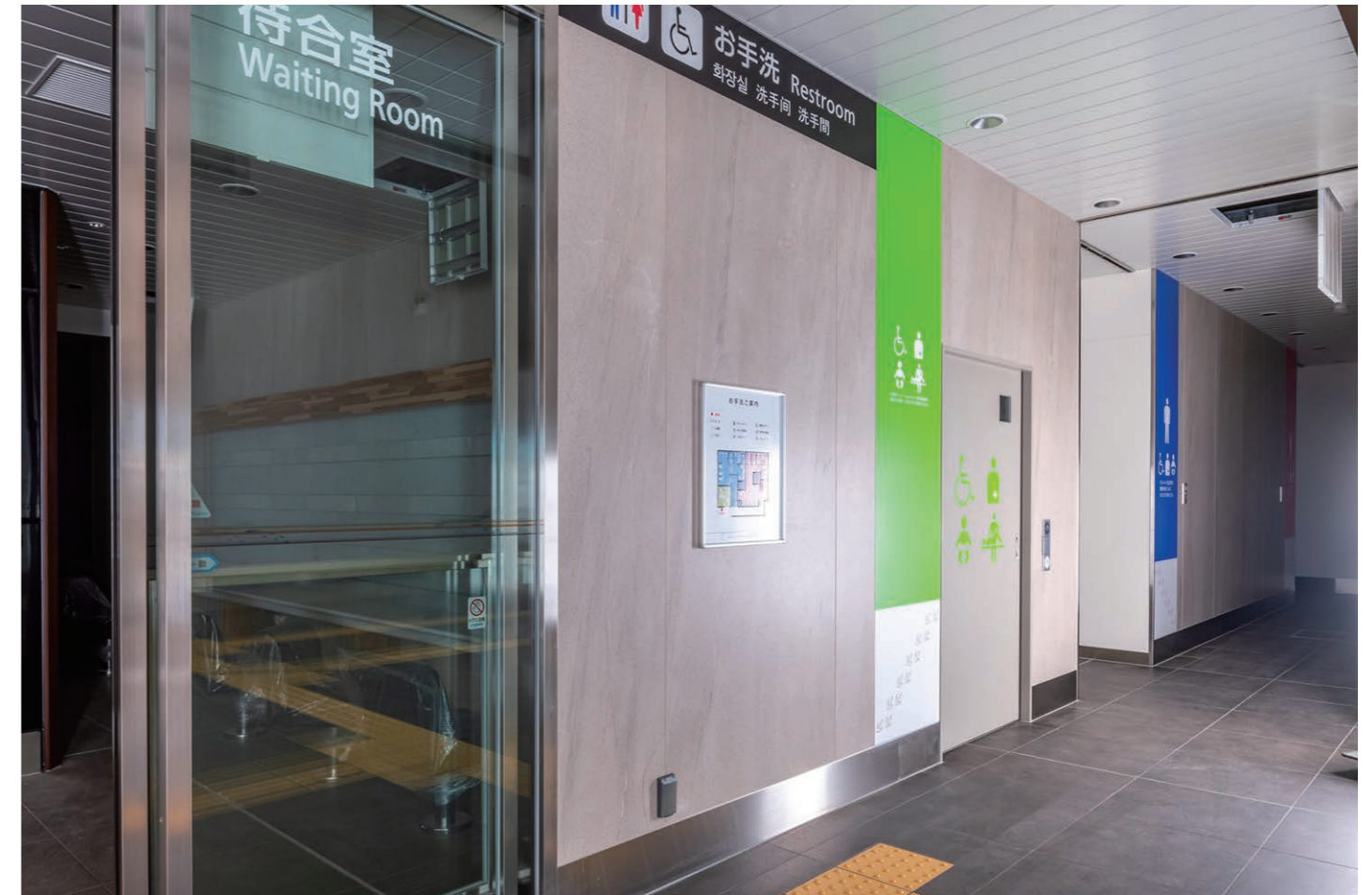
トイレ入り口まわり