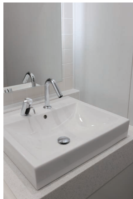
1F 女性用トイレ 洗面器

竣工から20年の節目の年に、新たなビジネス拠点としてリニューアル。国内の改修物件としては珍しいLEED認証を取得。