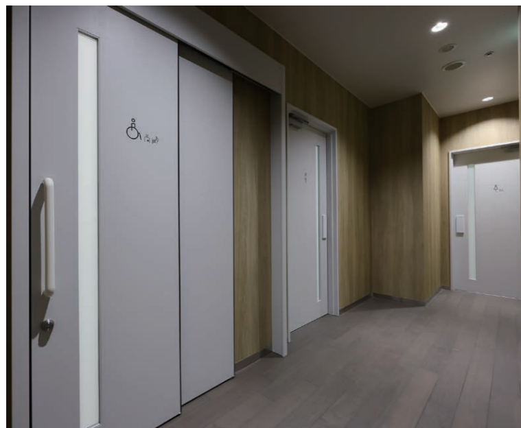
1F トイレ入り口まわり、トイレサイン