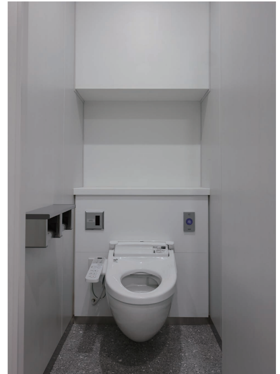
7F 女性用トイレ 大便器