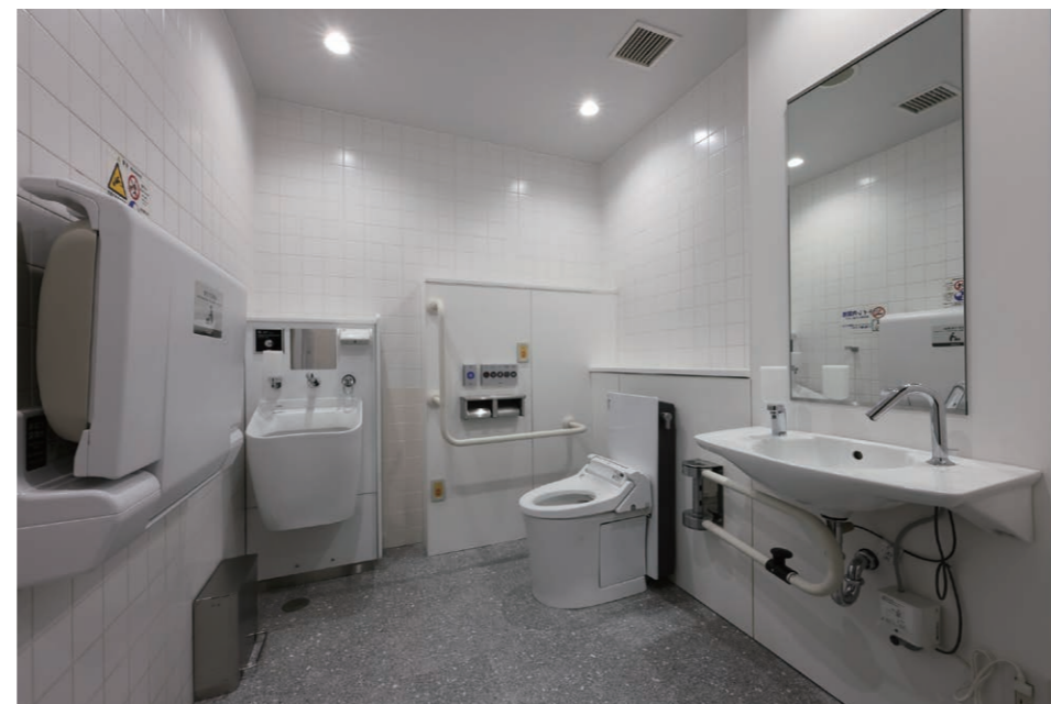
1F バリアフリースペース