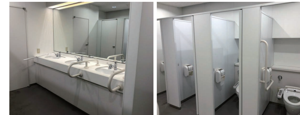
改修前(※イメージ・写真は5F)

竣工から20年の節目の年に、新たなビジネス拠点としてリニューアル。国内の改修物件としては珍しいLEED認証を取得。