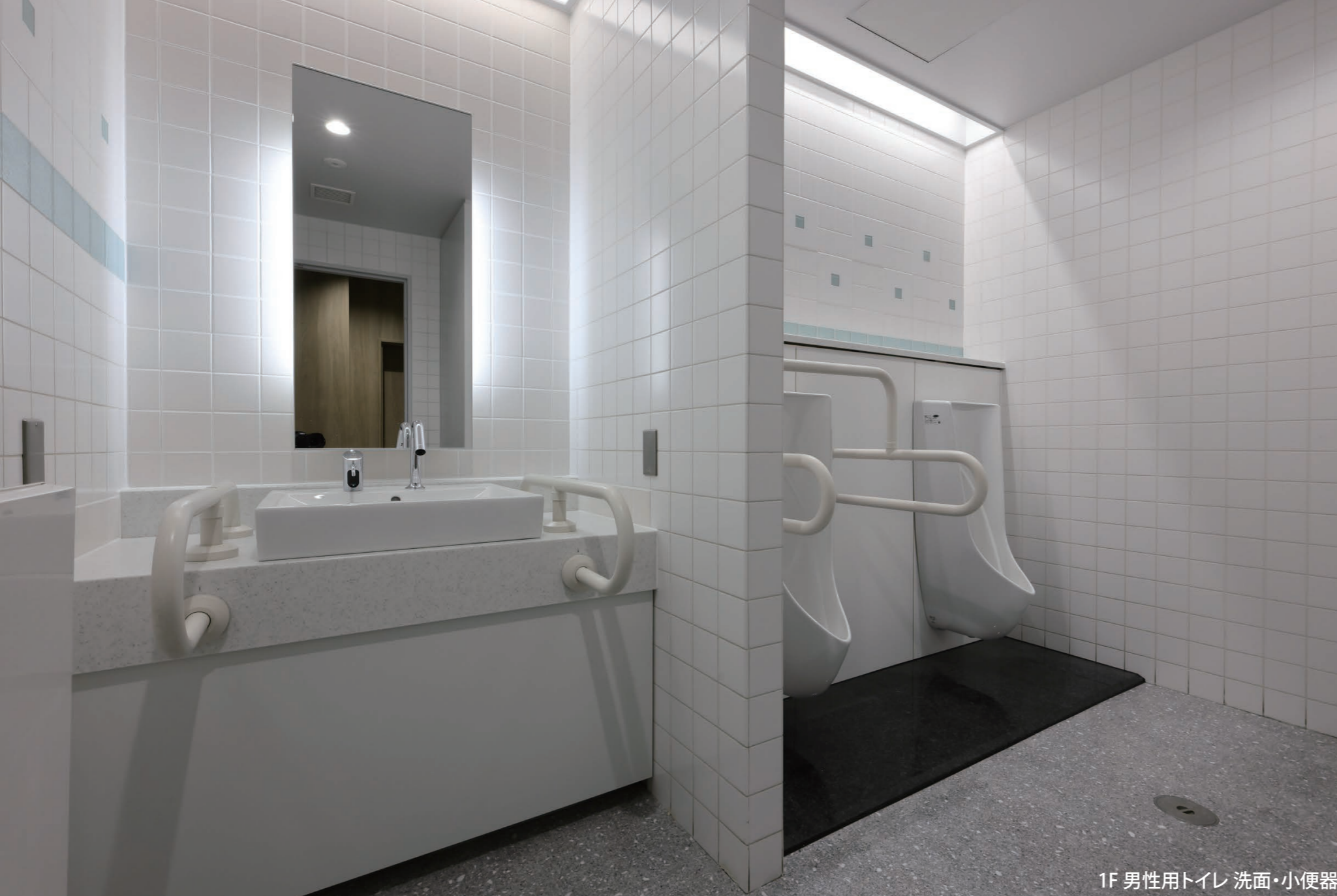
1F 男性用トイレ 洗面・小便器