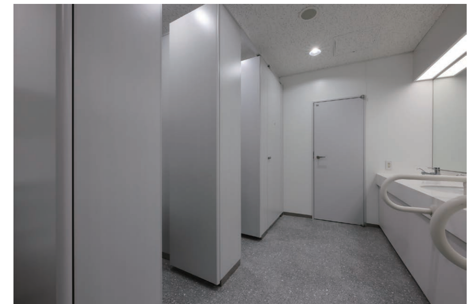
7F 女性用トイレ 内観