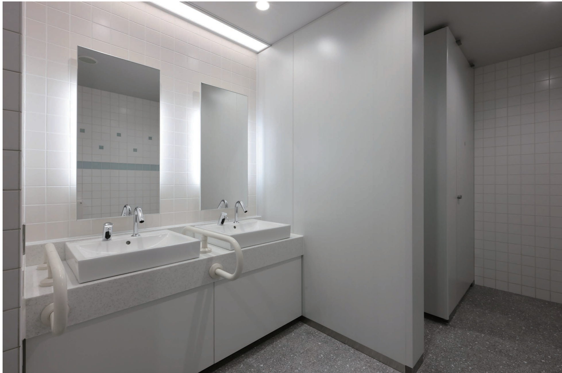
1F 女性用トイレ 洗面