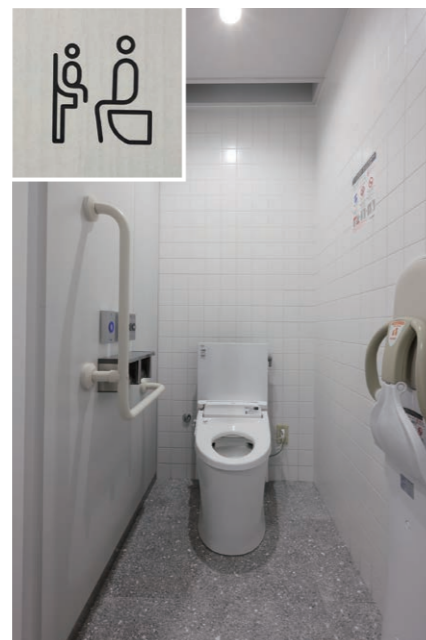
1F 女性用トイレ 大便器