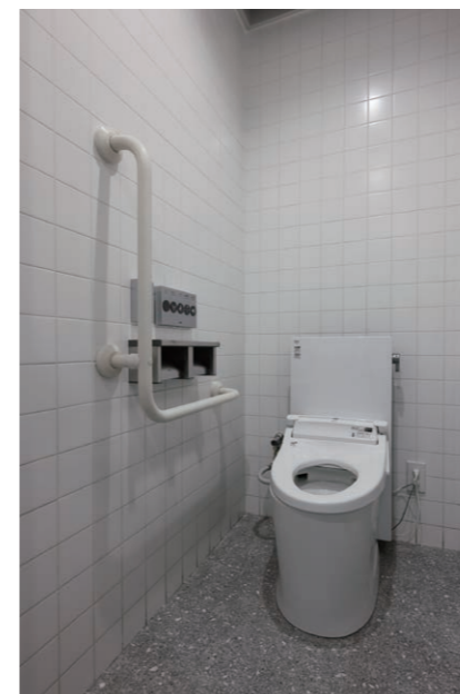
1F 女性用トイレ 大便器