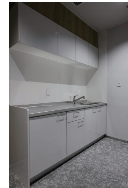
7F 給湯室 キッチン