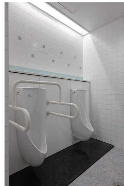
1F 男性用トイレ 小便器